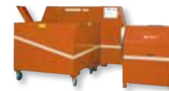
Brickman 900 K