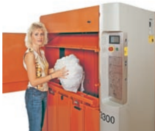
Olika typer av material, såsom papper eller plast, enkel påfyllning och komprimering.

Orwak 3300 är resultatet av drygt 30 års erfarenhet på marknaden. Trygg och säker för operatören. Stark och snabb för effektiv funktion. Kompakt och låg höjd för ökad flexibilitet. Modern design för att passa i skilda miljöer.